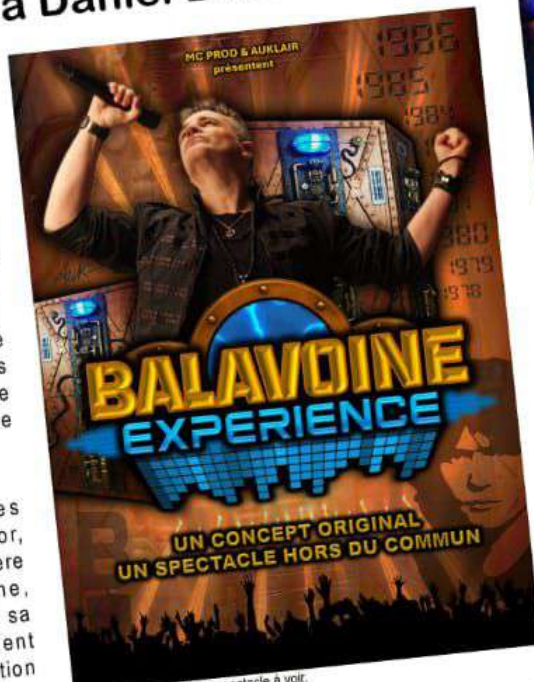
Héroïque Balavoine un spectacle à voir.